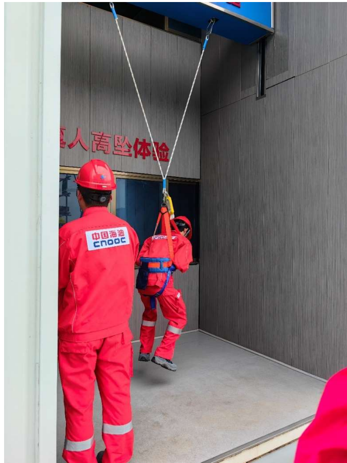
参观广东珠海金湾液化天然气有限公司现场演示