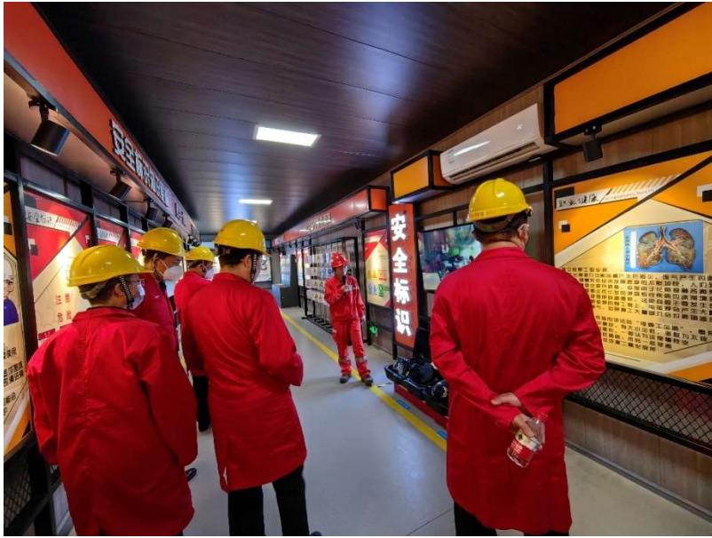
参观广东珠海金湾液化天然气有限公司