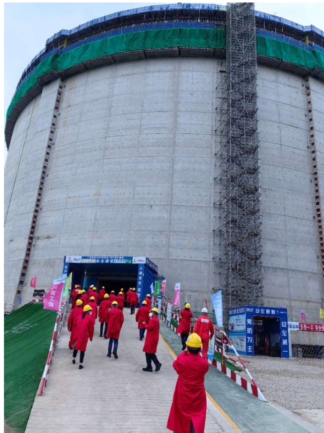
参观广东珠海金湾液化天然气有限公司 LNG 储罐

代表们饶有兴趣地参观了气电集团珠海 LNG 接收站。沉浸式安全体验中心、质量文化园、安全大道、众志成城墙、中和园、木铎园、三立园、思齐园、可为园、道生园、北辰园、文澜广场以及正在建设的二期工程使代表们叹为观止、受益匪浅。