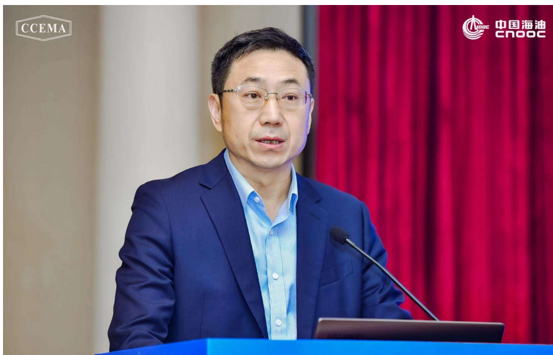
广东省珠海市人民政府常务副市长 杨川

刘国林代表傅向升以“聊百年企业，锻世界一流”为题发表讲话，列举了世界石化和中国石化百年企业的典型代表，以及在创新、转型，国际化方面带给我们的启示。一是创新是百年企业国际竞争力的核心要素；二是转型升级是百年企业迈向世界一流最重要的战略举措；三是国际化是企业走向世界一流的重要途径。他说：打造百年企业既要有愿景，更要有行动。中海油和气电集团已经走在了前列，并为我们探索和积累了经验。我们也要像他们那样在聚焦企业的竞争力、创新力、控制力、影响力和抗风险能力，以及持续推进创建示范、管理提升、价值创造和品牌引领“四个专项行动”上狠下功夫。